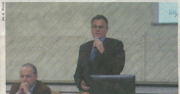
Burmistrz Miasta i Gminy Piaseczno Piaseczno, 3 maja 2008 r.

obywatelskiej na temat rewitalizacji centrum miasta. Owocem tego spotkania stała się podpisana przez Burmistrza deklaracja, w której wskazał on: – najważniejsze jego zdaniem problemy związane z rewitalizacją centrum miasta, – zadania z zakresu rewitalizacji, które zamierza zrealizować w 2008 roku, – zobowiązania z zakresu rewitalizacji, które będzie się starał zrealizować w ciągu całej kadencji (2006-2010).