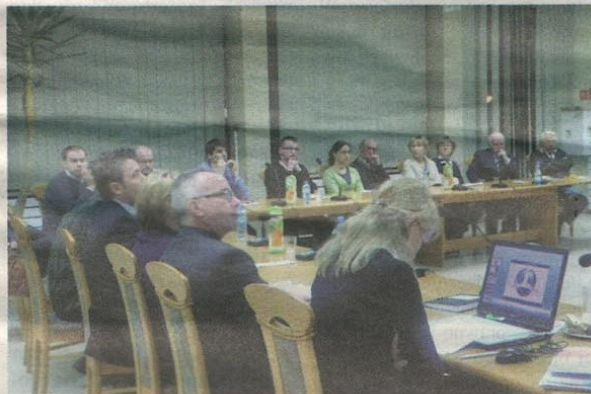
for K. Hradak

uzgadniania kwestii własnościowych, zwłaszcza z władzami powiatowymi. Zwrócił ponadto uwagę na punkty styczności występujące pomiędzy rewitalizacją, a komunikacją i sferą społeczną. Wśród najważniejszych obecnie projektów wymienione zostały: rewitalizacja dworca PKP wraz z otoczeniem (w tym budowa parkingu typu Park&Ride), rewitalizacja parku miejskiego oraz rewitalizacja Piaseczyńskiej Kolejki wąskotorowej. Jako działanie do zrealizowania w pierwszej kolejności burmistrz wskazał analizę strategiczną, której wykonanie zlecono firmie RDH Architekci