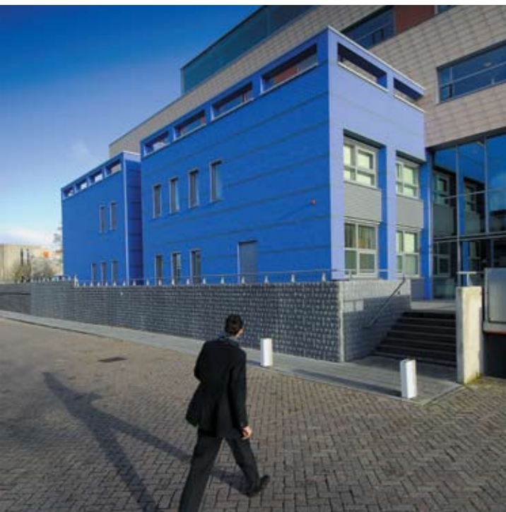
Ingang verpleeghuis Oudshoorn