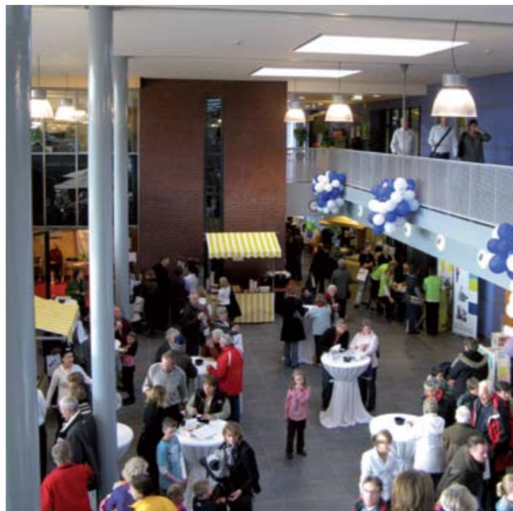
Opening 24 januari 2009

Het concept van een zorgboulevard staat of valt met een goede bereikbaarheid. Zorgboulevard Alphen aan den Rijn ligt in de stad en langs de Rijn. Vanuit architectonisch standpunt is gekozen voor de parkeergelegenheid met een goede bereikbaarheid aan de noordzijde waar ook de entree gelegen is. Vlakbij het entreeplein zijn een bushalte, taxistandplaatsen en voldoende stalruimte voor fietsen te vinden. Een half verdiepte parkeergarage met 230 plaatsen op twee niveaus zorgt voor een compacte, natuurlijk geventileerde parkeervoorziening met goed zicht op buiten en waar veel daglicht binnenvalt. Bomen die door beide niveaus groeien, geven een bijzondere charme aan de parkeerruimte. Door de entree en parkeervoorziening op het noorden te plaatsen, liggen de voorzieningen op het zuiden met een aantrekkelijk uitzicht op het stadsparkje, de rivier en de stad daarachter.