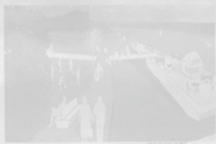
Tak ma wyglądać nabrzeże Wisły - miejsce od...

Holandrzy z firmy RDH mają pomysł na naszą zaniedbaną dzielnicę. Bulwar nad rzeką, przystanie jachtowe, osiedle za synagogą i centrum kulturalne w starej cegielni. Pierwszy inwestor już jest.