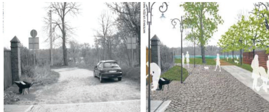
Tak jest dzisiaj Dojście do Wisły ul. Kapeluszników prowadzi przez zaniedbane wertepy

Spotkanie z mieszkańcami Fordonu, dotyczące planu dla tej dzielnicy, odbędzie się dziś w Szkole Podstawowej nr 4 przy ul. Wyzwolenia 4 o godz. 17.00.