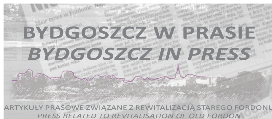
ARTYKUŁY PRASOWE ZWIĄZANE Z REWITALIZACJĄ STAREGO FORDONU PRESS RELATED TO REVITALISATION OF OLD FORDON