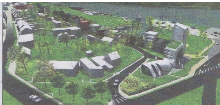
Według koncepcji firmy RDH, miasto ma być przede wszystkim reżyserem procesu rewitalizacji starego Fordonu, a nie głównym inwestorem przedsięwzięcia