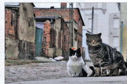
W uliczki planowanego obszaru rewitalizacji są w kiepskim stanie. Zrujnowane mury, tony porzuconych śmieci nie są najlepszym miejscem do życia. Nie zachęcają też do spacerów