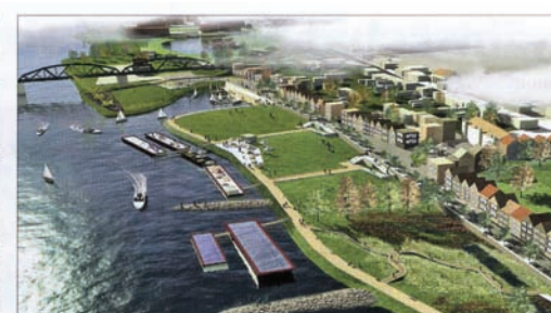
Wizualizacji nadbrzeże Wisły w Fordonie prezentuje się imponująco. Jeśli plan uda się zrealizować, nie tylko mieszkańcy Bydgoszczy, ale i turyści będą tu z przyjemnością zaglądać