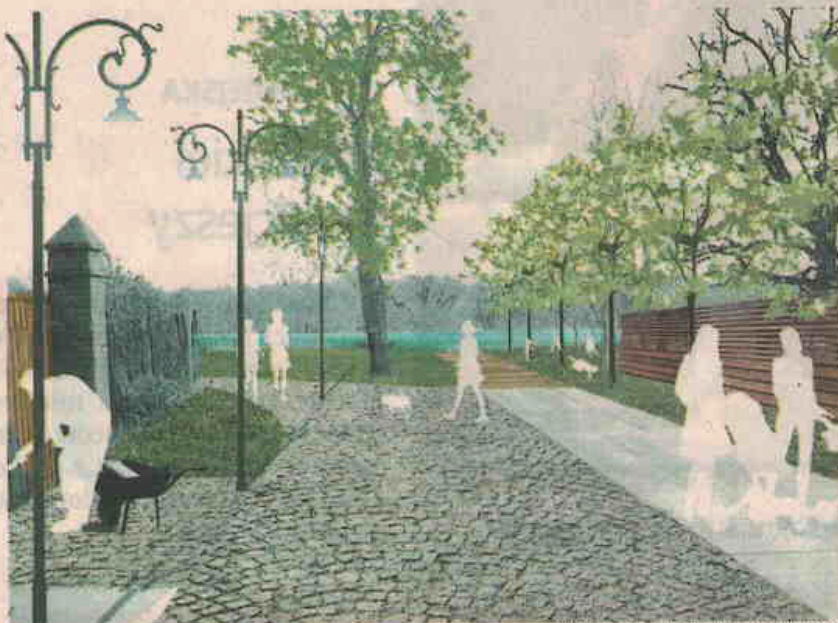
WIZUALIZACJA RDH „ARCHITEKCI”

Ulica Kapeluszników zamieni się w zadbane, urokliwy deptak