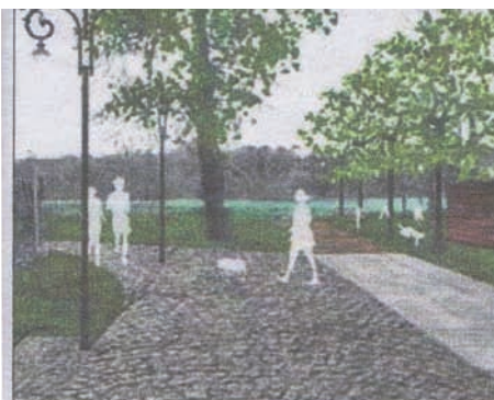
Tak, według projektu, ma wyglądać ulica Kapeluszników. Jednak na jej rewitalizację w budżecie zabrakło pieniędzy