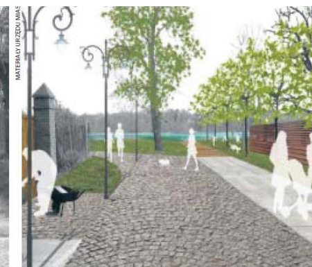
Tak będzie w przyszłości Stylizowana na starą kostka brukowa, estetyczne chodniki, piękna zielen