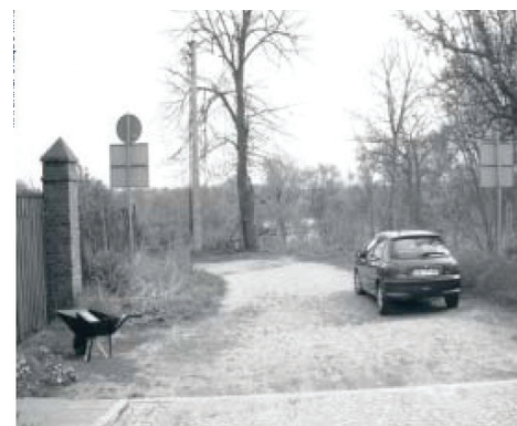
Tak jest dzisiaj Dojście do Wisły ul. Kapeluszników prowadzi przez zaniedbane wertypy

Droogh podkreśla, że do zrealizowania planów konieczna jest akceptacja ze strony mieszkańców, a często również zmiana ich mentalności. Holendrzy dodają: - Na każdym kroku chcemy konsultować swoje pomysły z fordoniakami, a ich oddolne inicjatywy będziemy brać pod uwagę przy realizacji inwestycji.